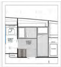
OPT GUEST CABIN